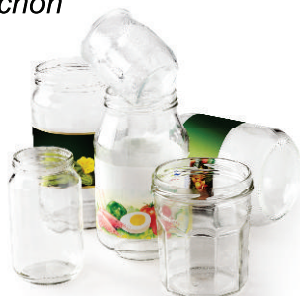
Pots et bocaux