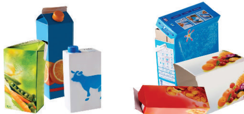
Briques alimentaires, cartons et cartonnets